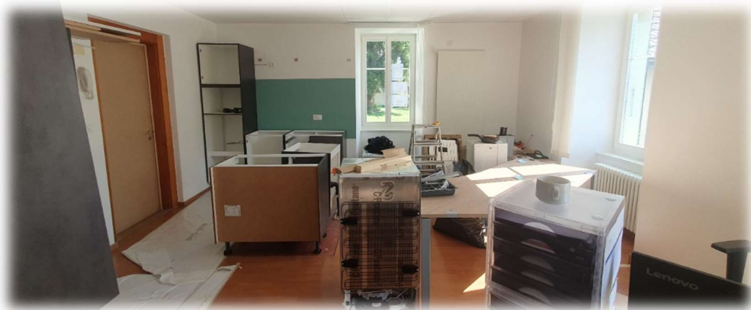
Photo : pendant les travaux

La Municipalité tient à remercier le Conseil Général pour sa confiance et son soutien dans la mise en œuvre de ce projet.