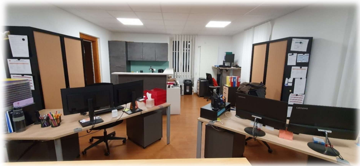
Photo : après les travaux

Par ailleurs, à l'image des travaux réalisés au collège, nous avons fait appel à des entreprises locales, compétentes et disponibles. La Municipalité les remercie sincèrement pour la qualité de leur travail et pour l'excellente collaboration menée dans une ambiance particulièrement agréable.